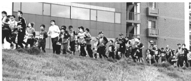
【3月20日 上下とも5km】