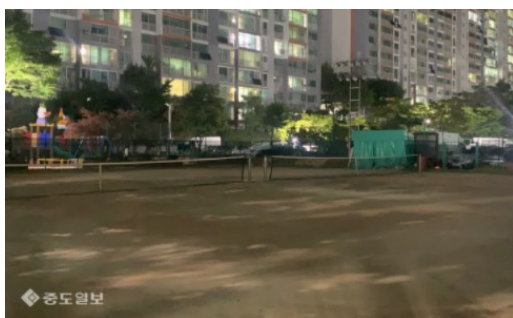
20日午後8時頃訪れた西区の屋外テニスコート。

このような状況なので地域で生活体育を楽しむ人は運動するスペースのほとんどを失って数ヶ月以上の運動を「オールストップ」した状態だ。