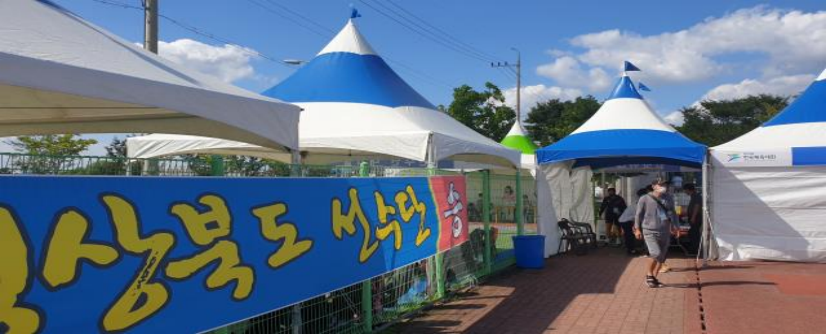
지난 8~13일 제102회 전국체육대회 하키 일반부 경기가 사전에 열린 대구 안심하키경기장. 코로나19 방역 절차를 거치며 대회 관계자들이 경기장으로 들어오고 있다.

코로나19에 따른 방역 차원이라고 하지만 문제가 많다. 애초에 체육인들의 의지가 전혀 반영되지 않았다. 대학일반부 경기 취소 확정시기도 너무 늦었다. 하키 등 일부 종목의 경우 이미 사전경기를 통해 우승팀과 시도 순위까지 가려진 상태다. 체육계의 현실을 전혀 반영하지 않은 일방적인 조치다.