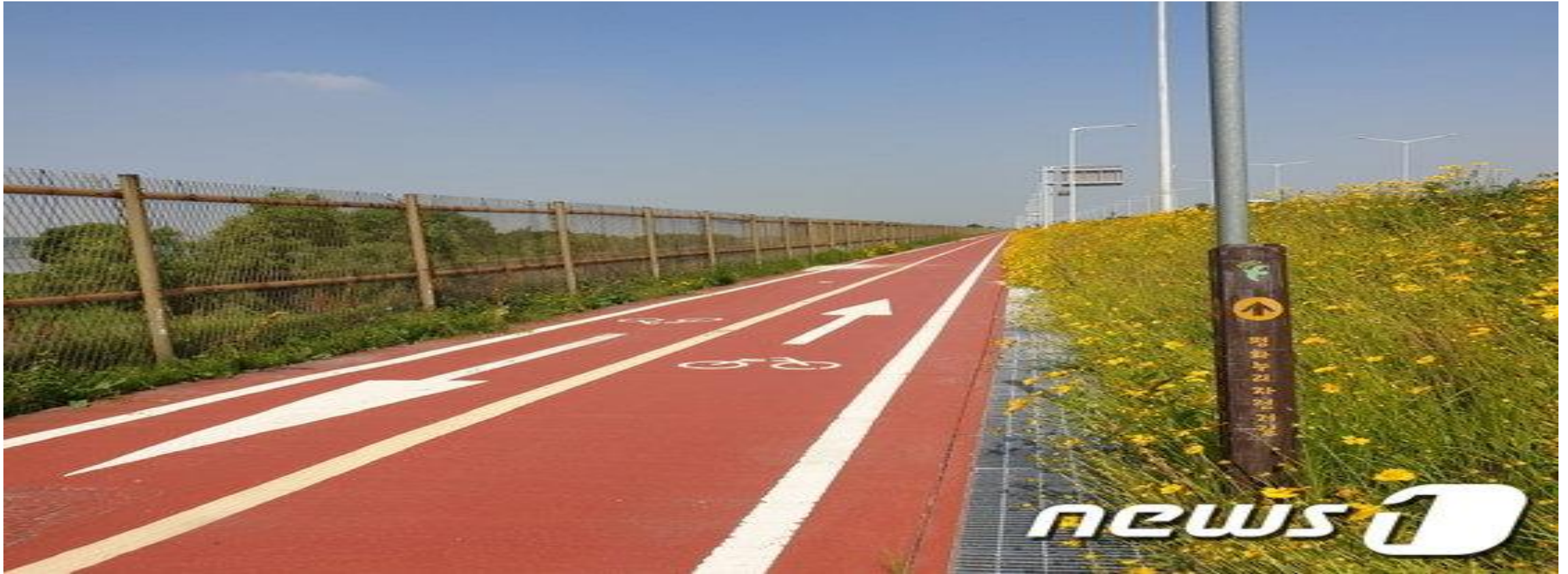
한적한 한강 하구 고양시 평화누리자전거길.

“벌써 1년 가까이 운동장에 나가질 못해 답답하고, 이러다 없던 병도 생길 것 같아요. 백신 접종도 어느 정도 단계에 올라왔으니 올해 안에는 회원들과 다시 만날 수 있겠죠?”